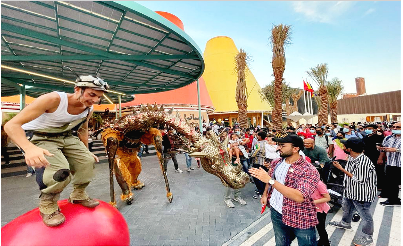
Tiritirantes generó máxima expectación ante el Pabellón de España.

Todos ellos levantaron pasiones y se convirtieron en auténticos embajadores del Pabellón, donde animaron a las cientos de personas que contemplaban el singular desfile a unirse a la ' inteligencia para la vida ' que preconiza el eslógan de España en la Expo. La compañía Tiritirantes volverá a estar del 3 al 5 de diciembre en la plaza del Pabellón de España a las 17.00, 18.00 y 19.00 horas.